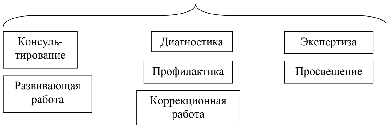
Основные направления психолого-педагогического сопровождения